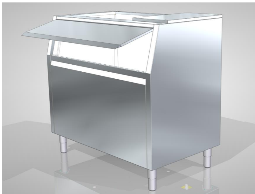
Рис. 2 Бункер с открытой дверцей

5.2 При заполнении бункера льдом (контролируется визуально) необходимо, не выключая льдогенератор, открыть дверцу бункера (рис. 2) и при помощи совка переложить лед в подготовленную емкость (не поставляется в комплекте).